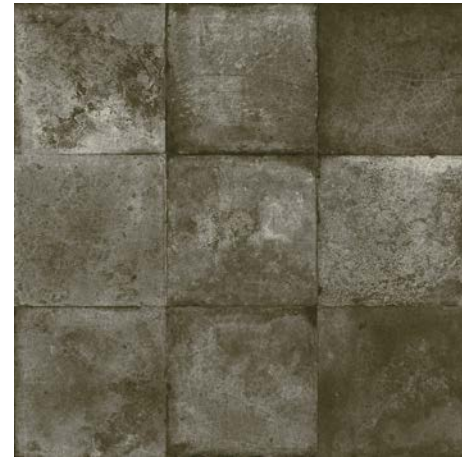
FS Etna Black