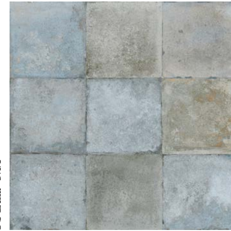
FS Etna Blue