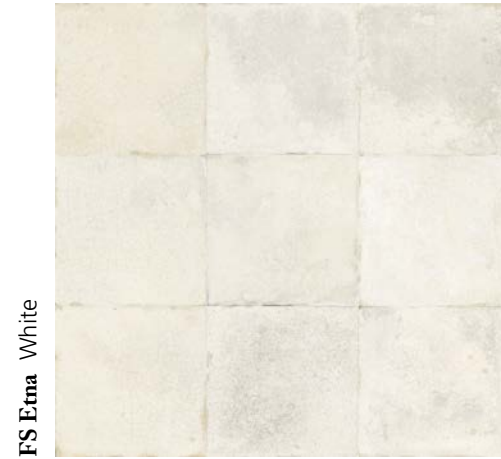
FS Etna White