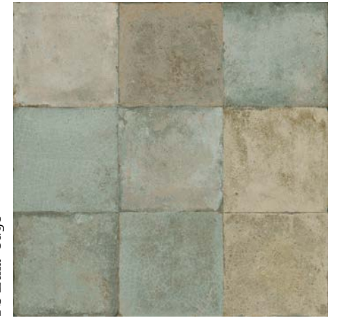
FS Etna Sage