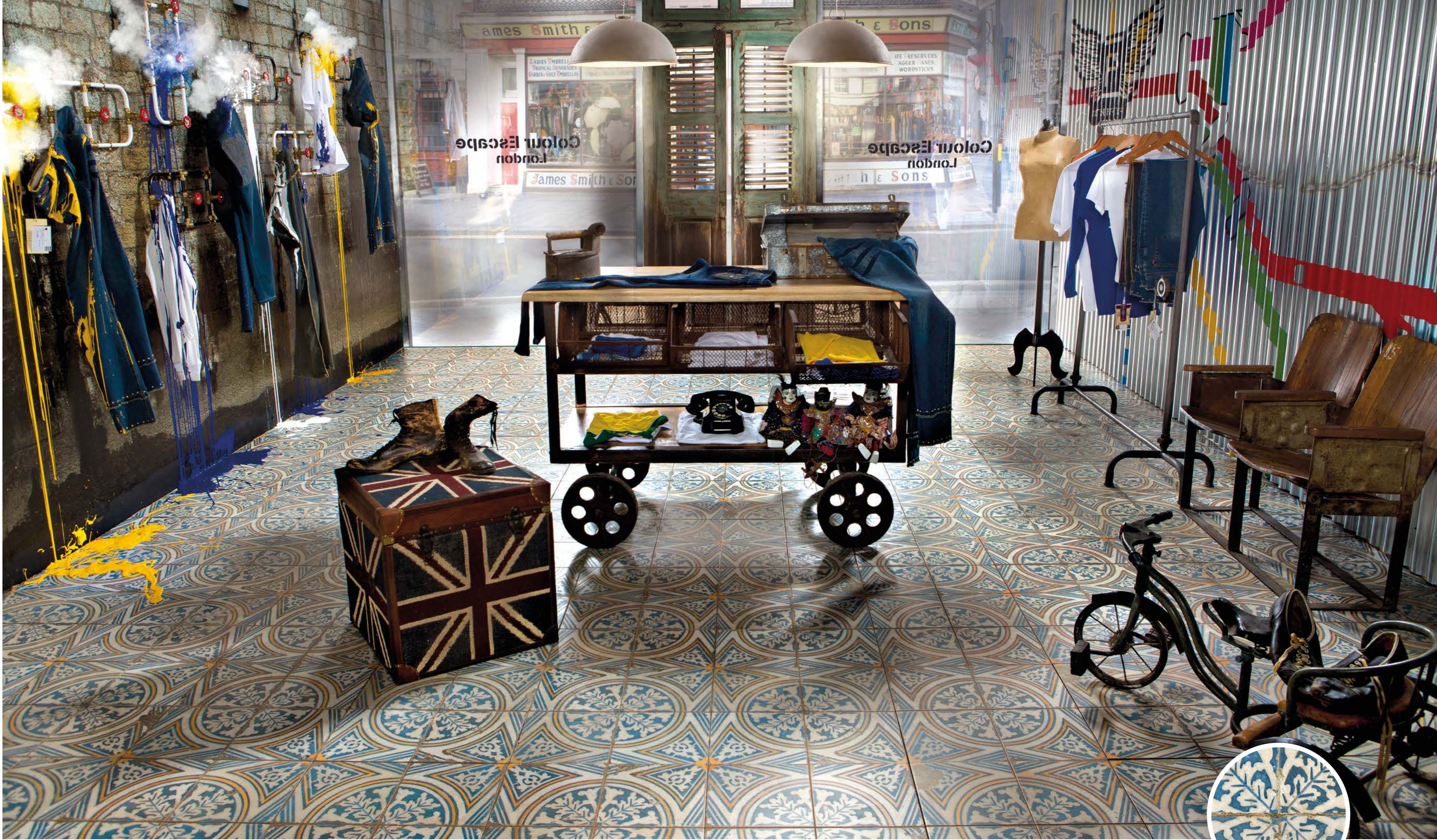
FS Original Single fired floor tiles